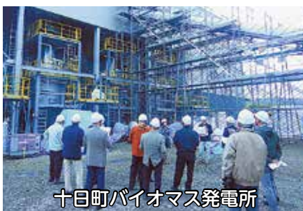
十日町バイオマス発電所