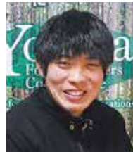
販売加工課 技術職員

日々危険な作業が多いですが、これからも安全作業を忘れないように続けていこうと思います。