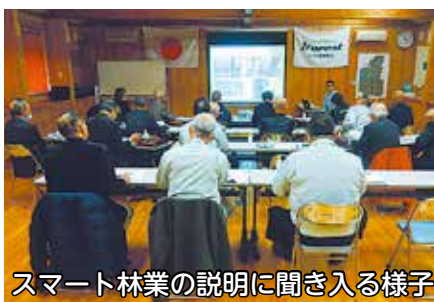
スマート林業の説明に聞き入る様子