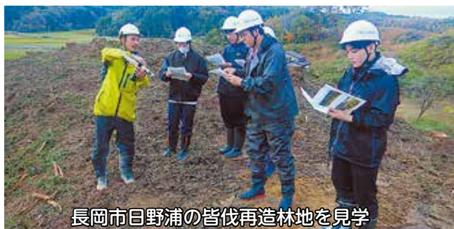
長岡市日野浦の皆伐再造林地を見学

昨年11月20日～22日に、農林中央金庫様の新入職員の教育研修を受け入れました。令和6年度新採用となった研修生3名が参加して、林業の基礎的な知識や新潟県並びに森林組合の取り組みについての講義後、長岡市日野浦地内の皆伐再造林地を見学し、和島林木育種園では実際に植栽作業を体験していただきました。最終日には、3日間の研修を通じた中で、研修内容の振り返りとそれぞれが感じた林業の役割や今後の林業への期待について活発な意見交換をさせていただくことができました。今後ますますのご活躍をお祈りいたします。