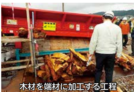
木材を端材に加工する工程

昨年11月7日～8日に役員視察研修を実施しました。視察先の十日町バイオマス発電所様では木質バイオマス発電の未利用材活用の取組について、長野県の北信州森林組合様においては、ICT活用によるスマート林業(木材生産管理)の取組について御担当者様からご教示いただきました。今後の木材生産の拡大と安定供給体制のシステム構築に向けて取り組んでまいりたいと思えます。