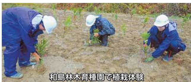
和島林木育種園で植栽体験