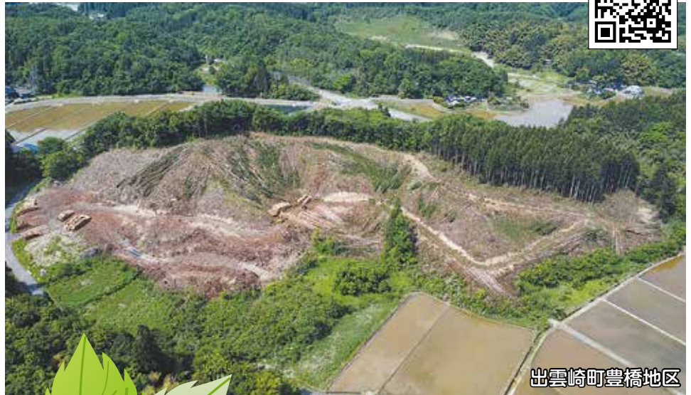
出雲崎町豊橋地区