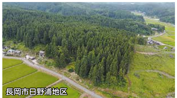
長岡市日野浦地区

また、調査等に時間がかかり、ご応募をいただいてから返答までに時間がかかる場合がございます。長らくお待ちして申し訳ございませんが、林内の調査、公道との接続や搬出経路等入念な調査が必要となるため、ご理解のほどよろしくお願い申し上げます。