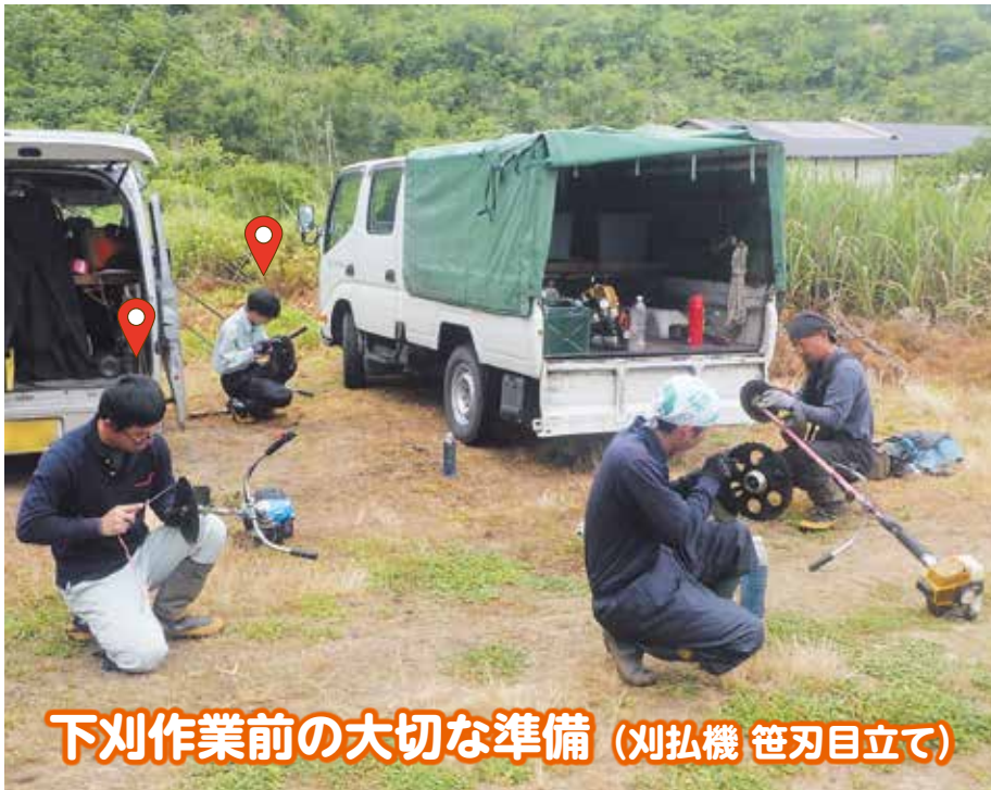
下刈作業前の大切な準備 (刈払機 笹刃目立て)