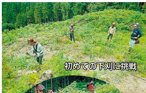
初めての下刈に挑戦

林業への就業を希望する方を対象に、林業の基礎知識の習得、実地研修、職場見学等を中心とした、林業就業支援講習の受講生7名が県内外から延べ8日間、私たちの生業に触れていただきました。これから一人でも多くの方が、林業に興味を持ち、仲間が増えたらとても嬉しいです。