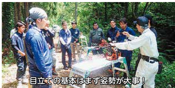
目立ての基本はまず姿勢が大事!

本年度も県内各地の26事業者から総勢56名の研修生が参加し、研修がスタートしました。