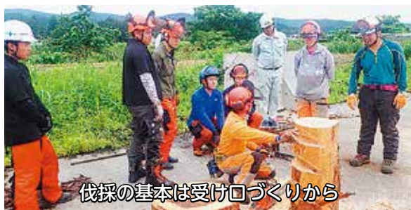
伐採の基本は受け口づくりから