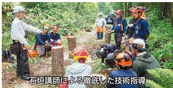
石垣講師による徹底した技術指導