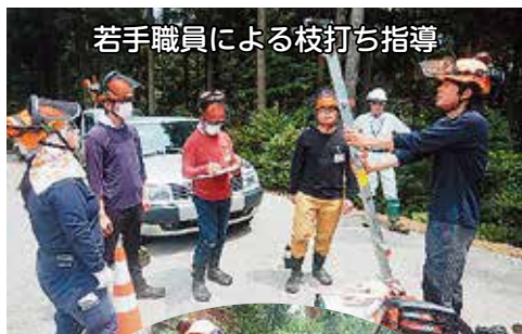
若手職員による枝打ち指導