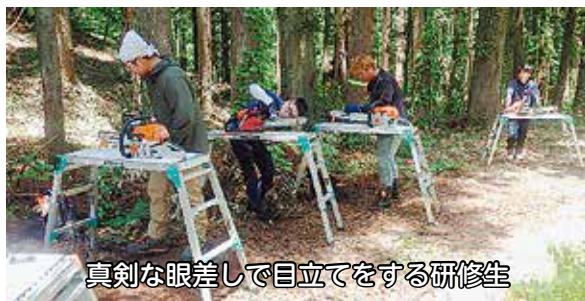
真剣な眼差しで目立てをする研修生