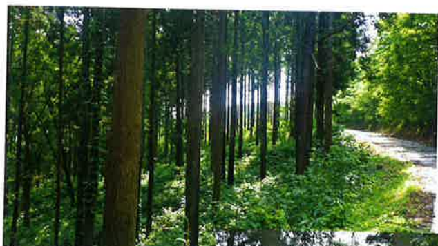
きれいに整備されたスギ林と林道

きれいに維持管理された林道を活用し、大規模な集約化施業により利用間伐や皆伐・再造林などの森林整備に取り組み、日頃より地域林業の振興にご尽力いただいておりますことに感謝申し上げます。益々のご活躍を祈念申し上げます。