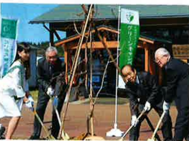
ベニシダレザクラとキンモクセイを植樹