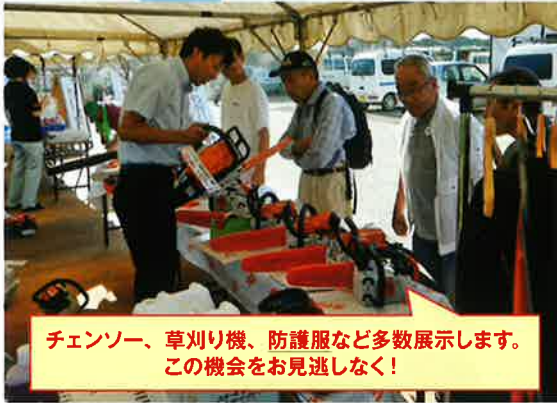
チェーンソー、草刈り機、防護服など多数展示します。 この機会をお見逃しなく！

【開催日時】 令和元年 10月5日(土) 午後1時から午後3時まで 会場：組合本所 裏面の地図をご参照ください。