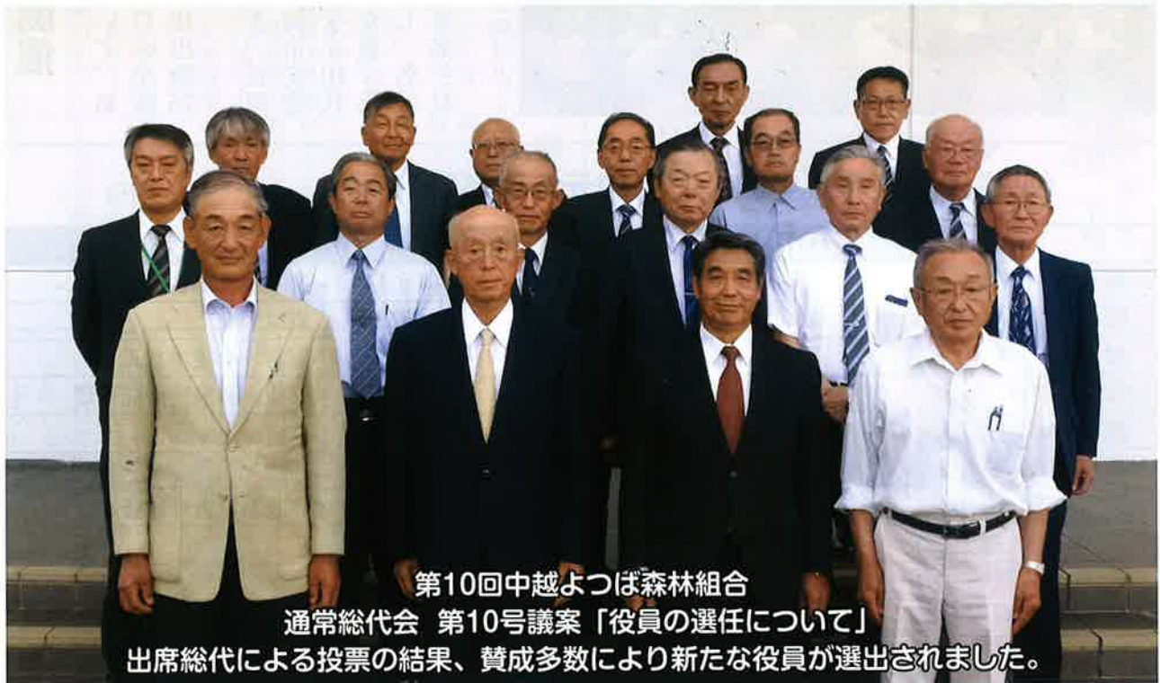
第10回中越よつば森林組合 通常総代会 第10号議案「役員の選任について」 出席総代による投票の結果、賛成多数により新たな役員が選出されました。