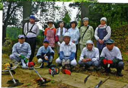
船橋林道管理組合の皆様