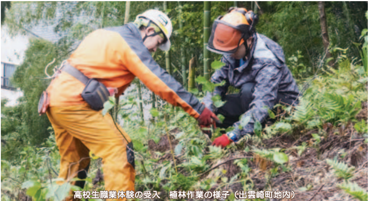
高校生職業体験の受入 植林作業の様子（出雲崎町地内）