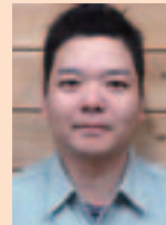
森林整備課 技術職員