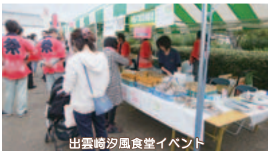
出雲崎夕風食堂イベント