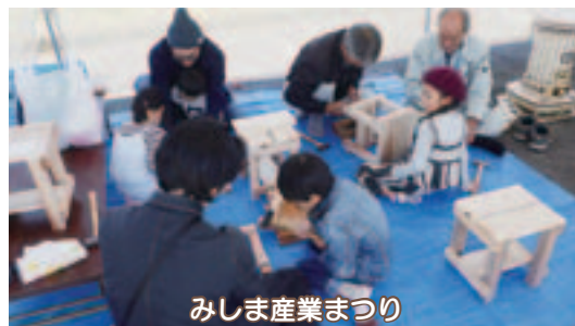
みしま産業まつり