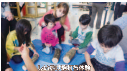
しいたけ駒打ち体験