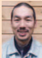
森林整備課 技術職員

林業は技術と経験が何よりも大切です。これからもたくさん学ぶことがあります。まずは安全に作業を行い、その上で技術を向上させていくことを目標にします。