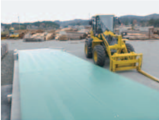
平成30年度 新潟県農林水産業総合振興事業 写真 左：木材計量器トラックスケール 40t 積載 写真 右：木材業仕様ホイールローダー 100PS

地域材の木材供給拠点の役割を果たすべく、木材貯木機能を高めて、間伐材生産を主体とした森林整備事業の推進を図ってまいります。