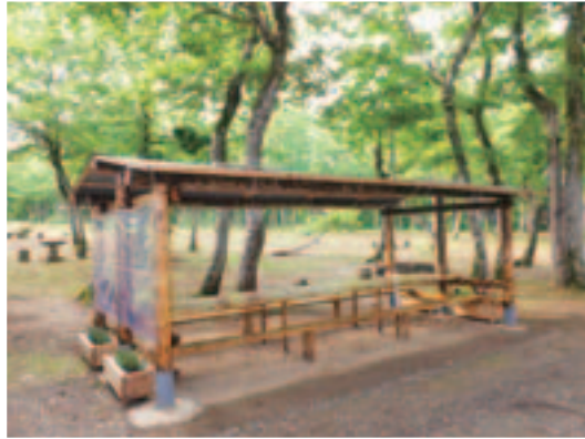
長岡市おぐに森林公園のバーベキュー施設 スギ丸太を使い綺麗に仕上がりました。