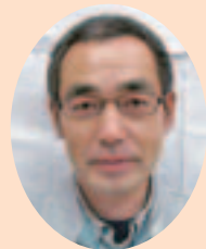
事業部 販売加工課 工場長