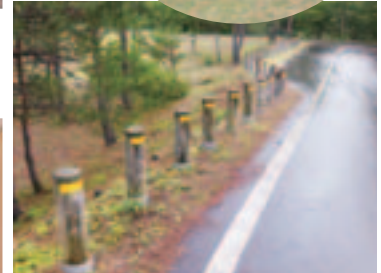
間伐材を使った工事用資材 (上:木柵、下:法面パネル)