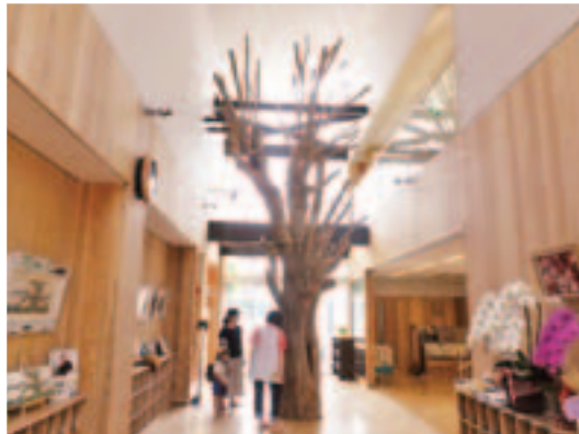
東光こども幼稚園様(長岡市上条町)から ご依頼いただき、施設内にシンボルツリー (カシの木)を設置しました。