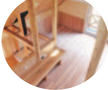
無垢の木材を使った 一般住宅