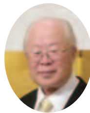
平成26年6月1日 第65回全国植樹祭にて受賞