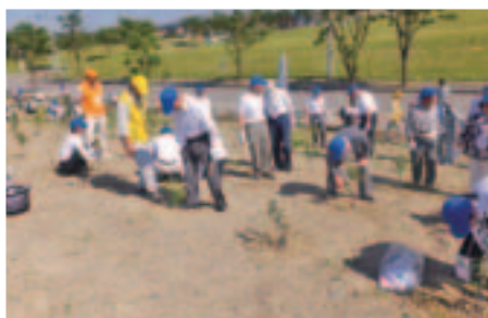
記念植樹会場の様子 (長岡市陽光台)