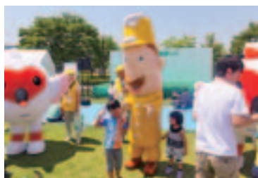
長岡サテライト会場でのボランティア活動の様子

組合にとっても今年の一大会展の一つである「全国植樹祭」。天候にも恵まれ、暑い一日となりました。当日は早朝から役員総出により参加をしました。 また、本番当日までの会場整備や製作準備など総合力を発揮して、全員参加による行事が無事に終わりました。