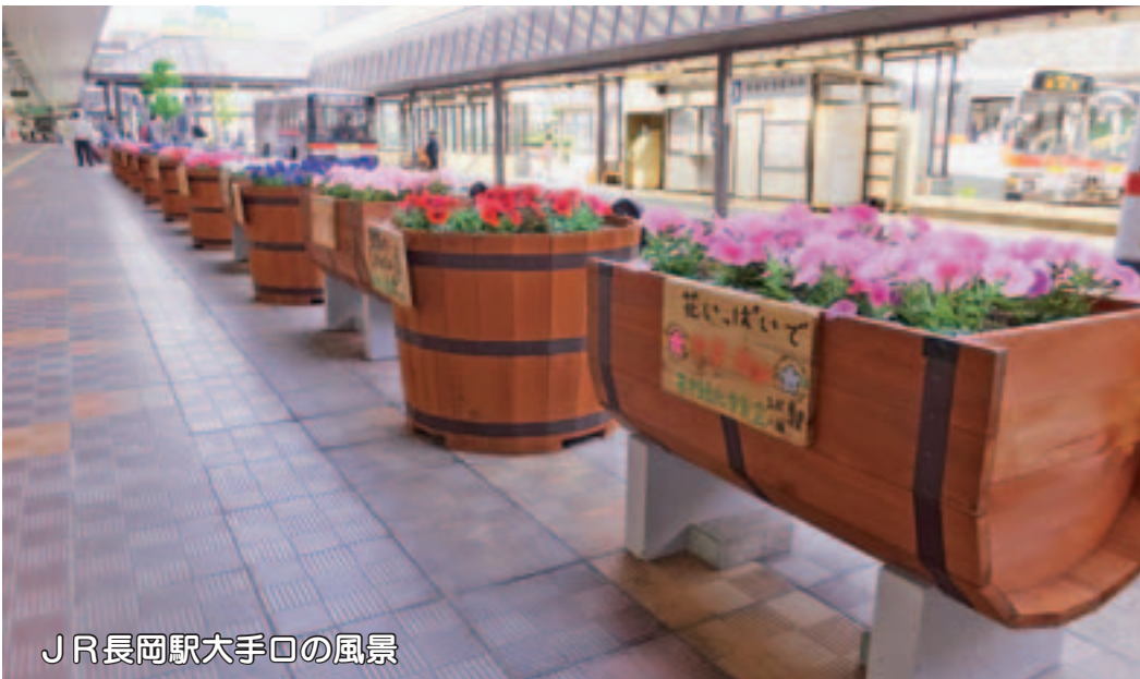
JR長岡駅大手口の風景