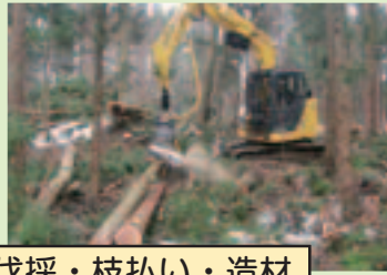
伐採・枝払い・造材