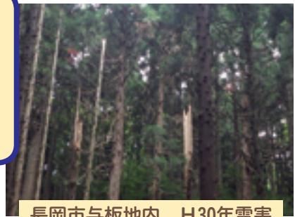
長岡市与板地内 H30年雪害