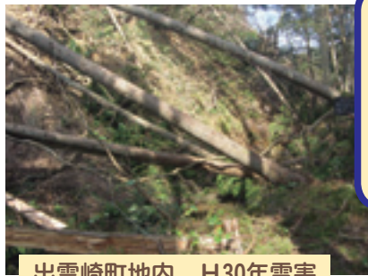
出雲崎町地内 H30年雪害

平成30年の大雪により、被害申請27件で約500万円のお支払予定 台風や集中豪雨、火災など万が一の災害に備えることができます。