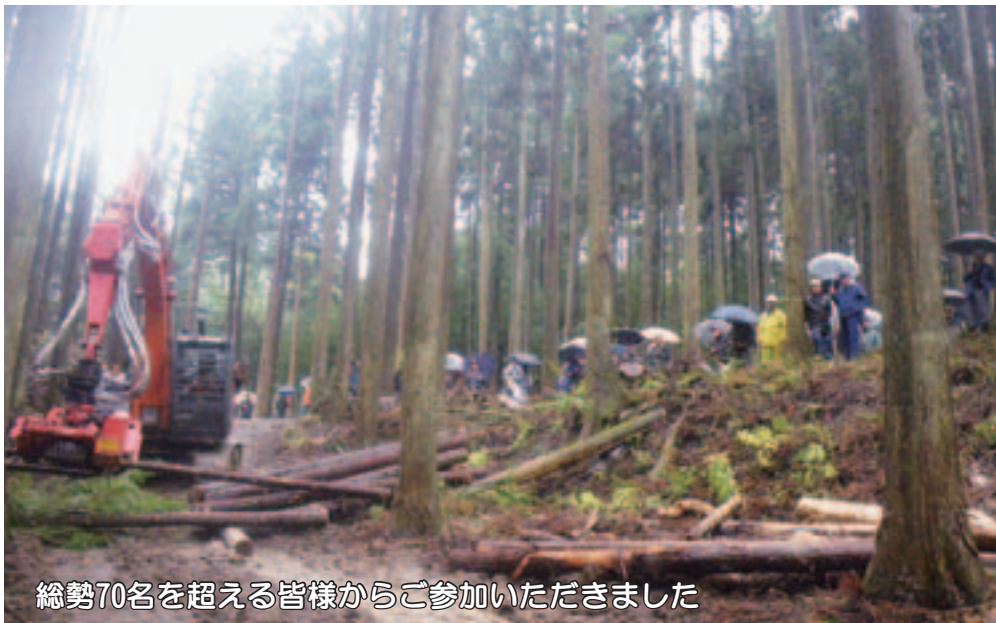
総勢70名を超える皆様からご参加いただきました