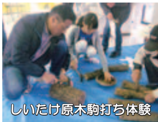
しいたけ原木駒打ち体験