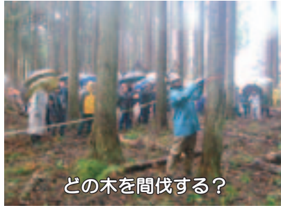
どの木を間伐する？