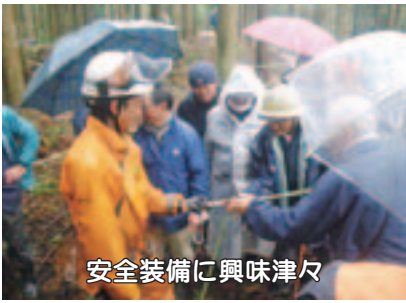
安全装備に興味津々

昨年11月、間伐事業の普及拡大を図ることを目的に、長岡市大積三島谷地区において現地説明会を開催しました。天候には恵まれませんでしたが、総勢70名を超えるご参加をいただき、普段は中々見る機会のない現場作業の様子を熱心にご覧いただきました。帰りには、職員が作った「きのこ汁」を振舞い、身体を暖めながら山の話で賑わいました。帰りは、職員が作った「きのこ汁」を振舞い、身体を暖めながら山の話で賑わいました。帰りは、職員が作った「きのこ汁」を振舞い、身体を暖めながら山の話で賑わいました。