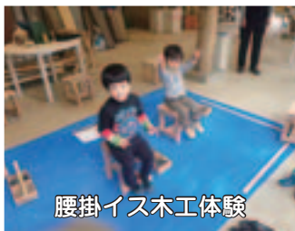
腰掛イス木工体験