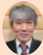
事業部 販売加工課 課長