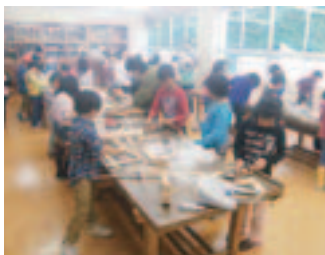
出雲崎小学校 木工体験教室