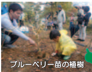
ブルーベリー苗の植樹