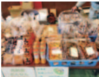
与板いきいきフェスティバル